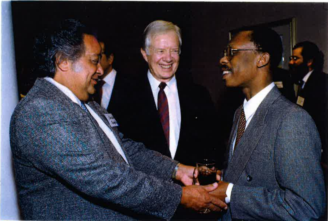
Shridath Ramphal (l) and Jimmy Carter (c) greet Haitian President Jean-Bertrand Aristide (r) at the consultation.