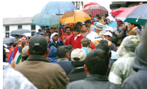
Un grupo de representantes de gobiernos locales participa en una manifestación frente al Palacio Presidencial en Quito — Ecuador. El Centro Carter trabaja en Ecuador para apoyar el proceso de la Asamblea Constituyente y prevenir conflictos.

Asimismo, el acceso a la información pública es importante para promover la confianza de los ciudadanos en sus gobiernos y para fortalecer una administración pública efectiva. El